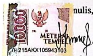
nulis, Lia Anggraeni

Demikian pernyataan ini saya buat dengan keadaan sadar dan tidak dipaksakan.