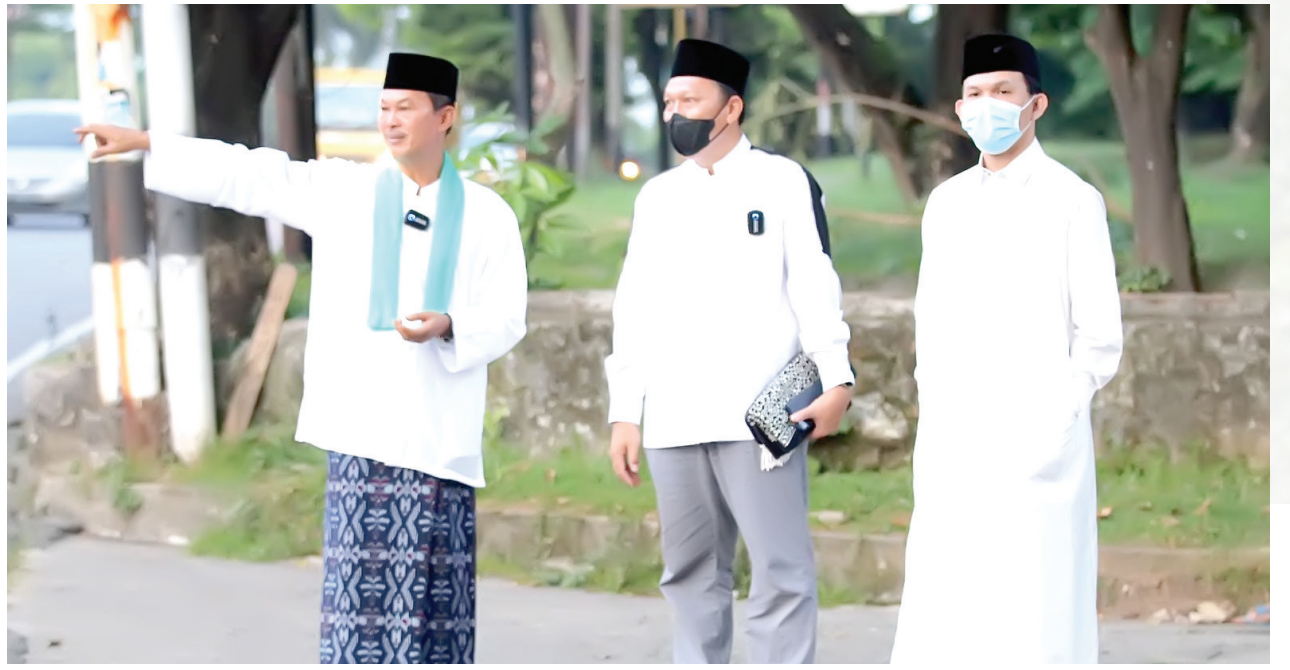
Walikota Palembang H. Harnojojo saat mendampingi masyarakat di Jalan Lunjuk Jaya Palembang, Senin (11/10).

Selain meninjau kondisi Jalan Lunjuk Jaya, Harnojojo juga melanjutkan perjalanannya guna meninjau lokasi bakal pembangunan Flyover Simpang Angkatan 66 dalam persiapan pelaksanaan pembangunan. "Kalau Flyover ini sudah terbangun, yang pastinya kota Palembang nantinya akan menjadi lebih bagus. Jadi, selain di Keramasan, Bandara dan Jakabaring, nantinya Flyover kita akan bertambah di sini (red)," katanya. (*)