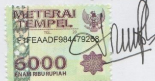
Yessy Efrida. T