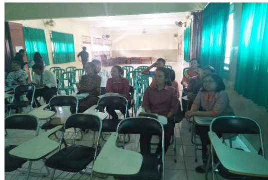
Gambar 2 .Peserta sosialisasi