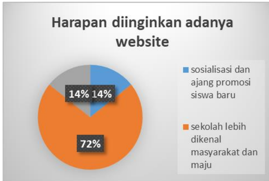
Tabel 2. Harapan guru adanya website

Kepuasan pelanggan merupakan penilaian suatu produk, kinerja atau jasa sesuai dengan harapan yang diinginkan oleh pelanggan (Kotler & Amstrong, 2001). Hasil survey awal pada para guru melaporkan bahwa sekolah membutuhkan platform untuk memperkenalkan sekolah, aktivitas siswa dan sarana informasi. Hasil evaluasi terhadap website yang diberikan, guru mengaku puas dan berharap website dapat digunakan sebagai sarana yang mempermudah informasi kepada wali murid, sosialisasi dan promosi untuk mahasiswa baru serta harapannya dengan adanya website sekolah menjadi lebih maju. Berikut hasil tabel harapan guru terhadap website sekolah.