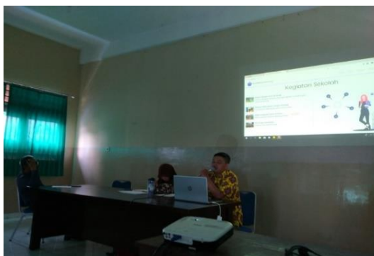
Gambar 1. Presentasi tata cara menggunakan website

Guna mengatasi permasalahan sekolah yang tidak adanya wadah untuk menyebarkan informasi dan promosi sekolah, kami melakukan sosialisasi website sekolah yang sudah dibuat. Adapun fasilitas yang kami berikan adalah materi tata cara menggunakan website. Kami menggunakan aula sekolah sebagai tempat pelatihan yang memiliki fasilitas LCD, microphone dan kursi. Peserta yang hadir pada kegiatan sosialisasi pembuatan website adalah 14 guru SMP.