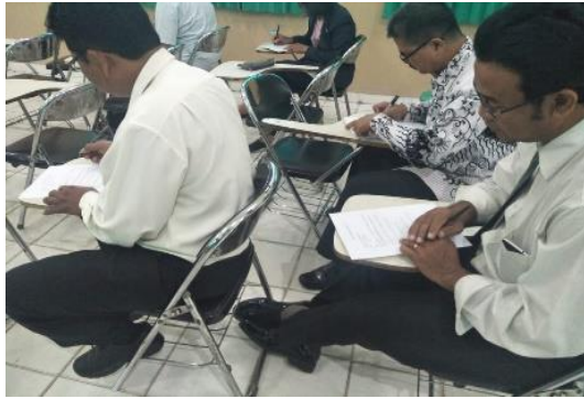
Gambar 3. Tampilan website sekolah