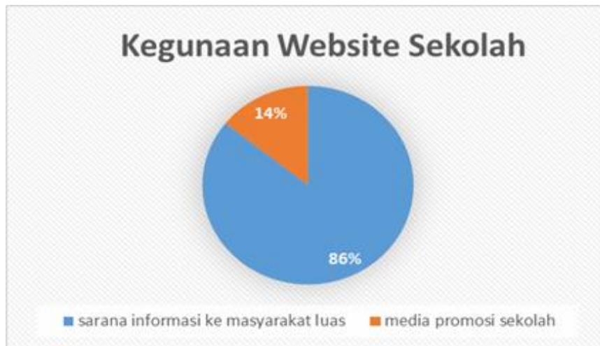
Tabel 1. Kegunaan website sekolah

Berdasarkan hasil observasi dan wawancara pada kepala sekolah, wakil kemahasiswaan dan guru di SMP Indriasana, diketahui sekolah membutuhkan alat untuk memberikan pengumuman, sarana promosi dan sarana komunikasi dengan wali kelas ataupun alumni. Selama ini proses informasi yang diberikan kepada wali murid diberikan secara manual lewat surat ataupun pengumuman. Berdasarkan hasil survey kepada 14 guru di SMP Indriasana, guru sangat menyambut baik adanya website sekolah karena selama ini sekolah tidak memiliki website. Hasil survey dari kuesioner yang diberikan menunjukkan 86% guru menyebutkan website sekolah berguna sebagai media informasi, 14% mengatakan website dapat digunakan sebagai media promosi sekolah.