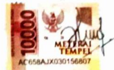
Hesi Uli Sitompul