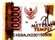
Hesi Uli Sitompul