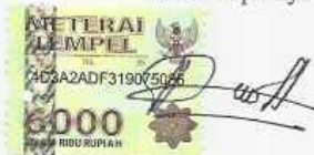
Ricardo Finelius Situmorang