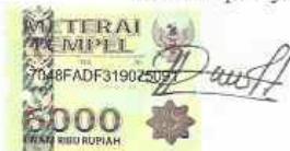
Ricardo Finelius Situmorang