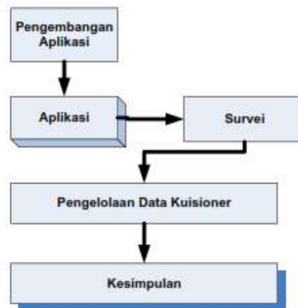
Gambar 2. Proses Penelitian

diupload ke googleplay , media inilah yang menjadi objek penelitian guna menghasilkan penilaian dari end user . Hasil penilaian ini diproses guna melihat ketertarikan pengguna dalam menggunakan aplikasi tersebut, ketertarikan ini melihat juga dari fungsi yang terdapat pada tampilan aplikasi yang ada, seperti : gambar informasi dari penyebab jenis penyakit yang diderita. Berikut gambar proses kegiatan penelitian dalam penilaian aplikasi sampai dengan mendapatkan kesimpulan.