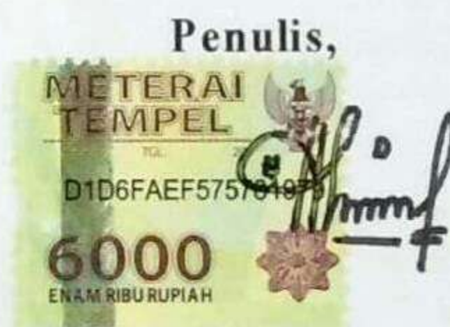
Diah Ayu Ningsih