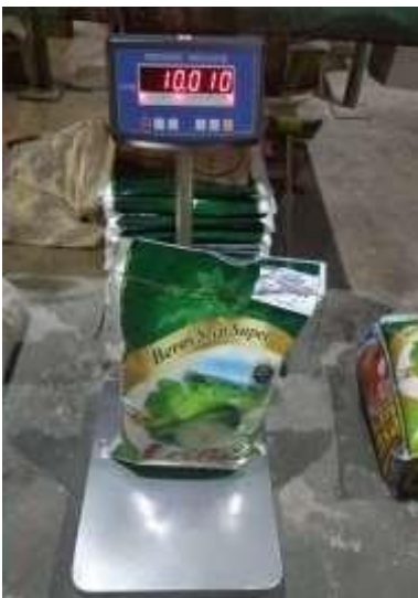
Gambar 7. Beras 10