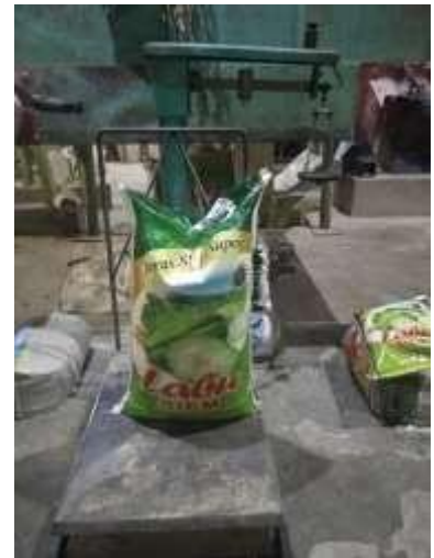
Gambar 3. Beras 20