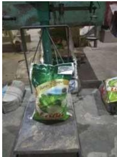
Gambar 2. Beras 10