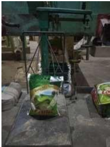
Gambar 1. Beras 5