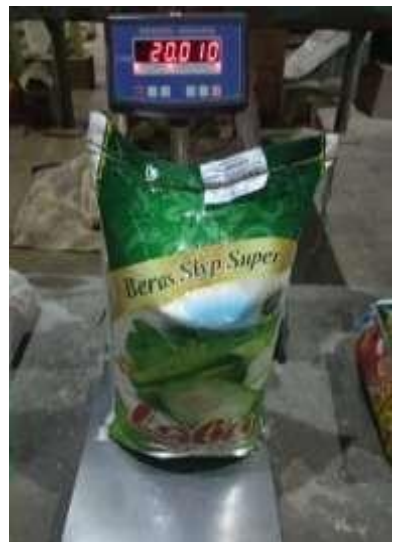
Gambar 8. Beras 20