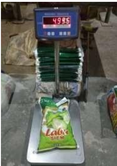
Gambar 6. Beras 5