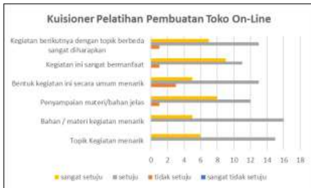
Gambar 2. Grafik rekap kuisioner toko online

Respon dari peserta dalam kegiatan ini dapat dilihat dari kuisioner yang telah diisi, tentunya untuk melihat dampak dari kegiatan ini membutuhkan waktu minimal 1 semester atau 6 bulan dengan pendampingan yang aktif setiap bulannya.