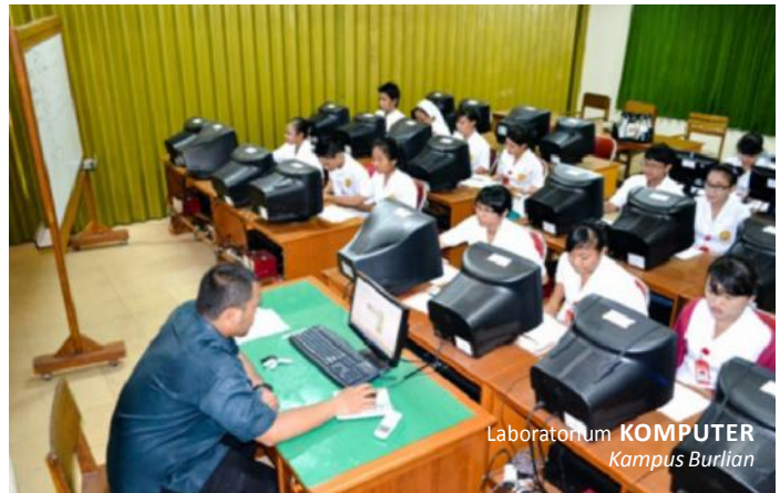
Laboratorium KOMPUTER Kampus Burlian