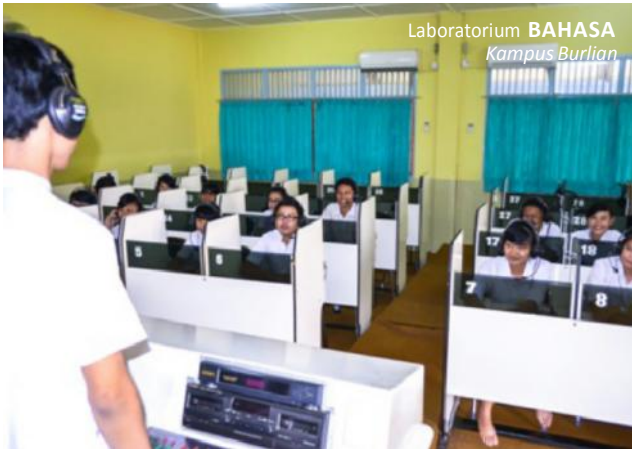
Laboratorium BAHASA Kampus Burlian