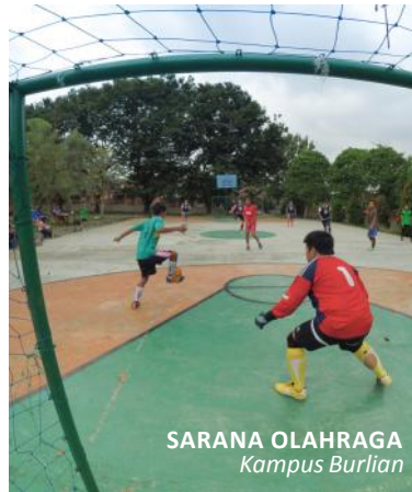
SARANA OLAHRAGA Kampus Burlian