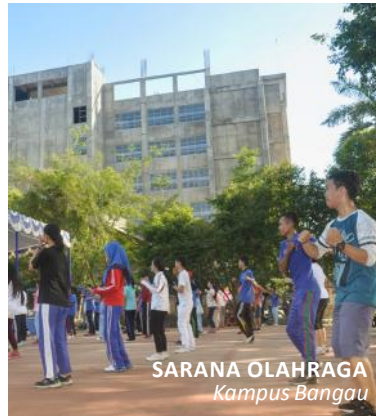
SARANA OLAHRAGA Kampus Bangau