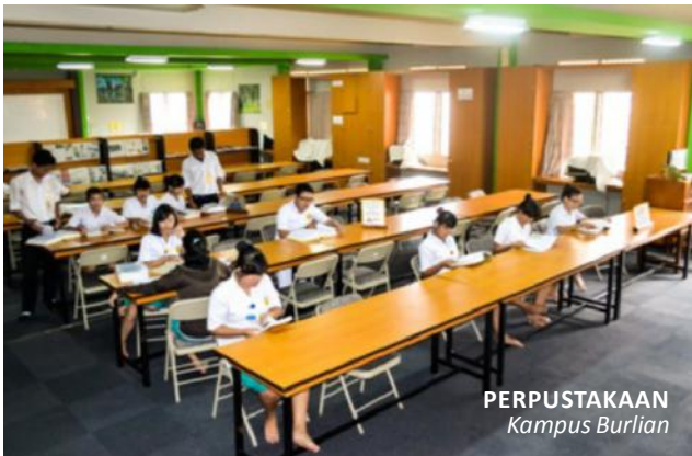
PERPUSTAKAAN Kampus Burlian