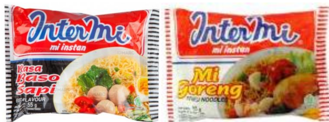
GAMBAR I-9 VARIAN RASA PRODUK INTERMI PRODUKSI PT INDOFOOD CBP SUKSES MAKMUR TBK DIVISI NOODLE

Intermi merupakan produk mie instan yang terbagi menjadi 2 jenis yaitu mie kuah dan mie goreng. Varian rasa Intermi meliputi Intermi goreng, Intermi rasa baso sapi dan Intermi rasa kaldu ayam. Varian rasa produk Intermi dapat dilihat pada Gambar I-9.