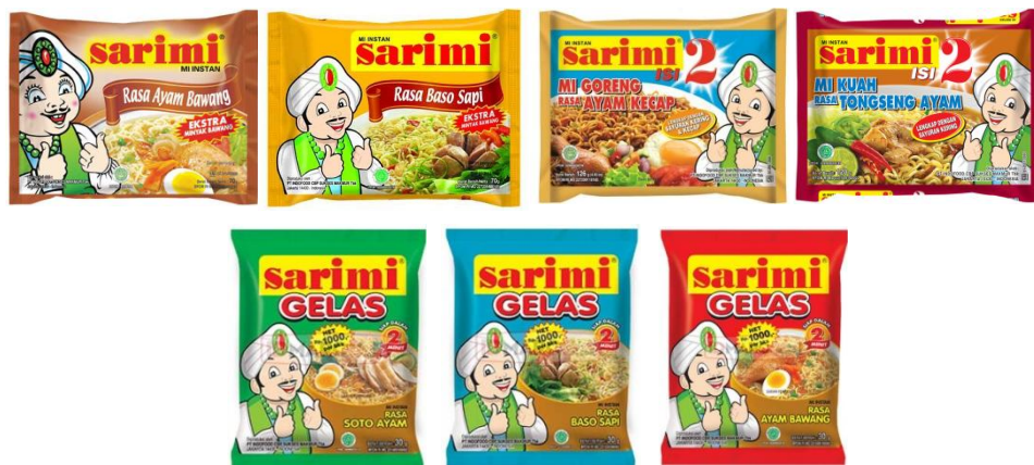
GAMBAR I-5 VARIAN RASA PRODUK SARIMI PRODUKSI PT INDOFOOD CBP SUKSES MAKMUR TBK DIVISI NOODLE

Beberapa varian rasa produk Sarimi dapat dilihat pada Gambar I-5 berikut.