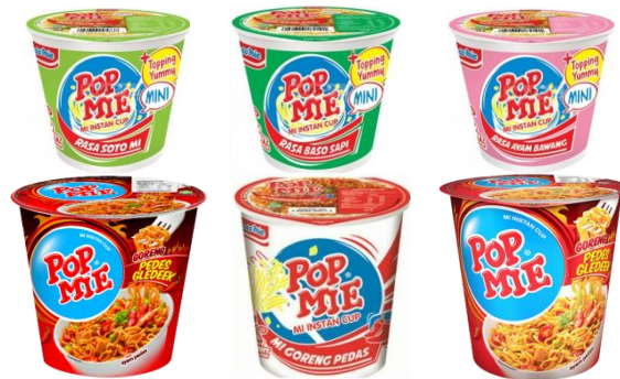
GAMBAR I-7 VARIAN RASA PRODUK POP MIE PRODUKSI PT INDOFOOD CBP SUKSES MAKMUR TBK DIVISI NOODLE

Pop Mie merupakan jenis mie instan yang dikemas dalam bentuk cup. Pop Mie mulai diproduksi pada tahun 1987. Varian rasa Pop Mie juga beraneka ragam, yaitu Pop Mie rasa ayam, Pop Mie rasa ayam bawang, Pop Mie rasa baso, Pop Mie rasa soto ayam, Pop Mie goreng pedes gledes, Pop Mie goreng pedas, Pop Mie Pedes Dower rasa ayam pedas dan lain-lain. Adapun Pop Mie terbagi menjadi 2 pilihan porsi, yaitu porsi mini dan porsi jumbo. Beberapa varian rasa produk Pop Mie dapat dilihat pada Gambar I-7 berikut ini.