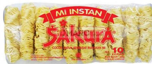
GAMBAR I-6 PRODUK MIE SAKURA PRODUKSI PT INDOFOOD CBP SUKSES MAKMUR TBK DIVISI NOODLE

Jenis Mie Sakura yang diproduksi berupa mie bal-balan yang terdiri dari 10 blok mie disetiap kemasannya. Mie Sakura bal-balan ini tidak dilengkapi dengan bumbu perasa. Produk Mie Sakura dapat dilihat pada Gambar I-6.