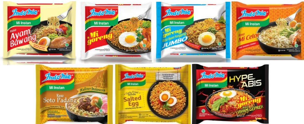
GAMBAR I-3 VARIAN RASA PRODUK INDOMIE PRODUKSI PT INDOFOOD CBP SUKSES MAKMUR TBK DIVISI NOODLE

Sumber : PT Indofood CBP Sukses Makmur Tbk Divisi Noodle Departemen Produksi