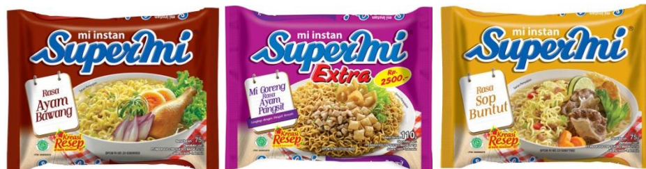
GAMBAR I-4 VARIAN RASA PRODUK SUPERMI PRODUKSI PT INDOFOOD CBP SUKSES MAKMUR TBK DIVISI NOODLE

Supermi mulai diproduksi pada tahun 1968 sebagai mie instan serbaguna. Supermi adalah produk yang diluncurkan sebelum Indomie sebagai mie instan serbaguna, namun sesudah Indomie sebagai mie instan berbumbu. Varian rasa Supermi meliputi Supermi rasa ayam bawang, Supermi rasa ayam spesial, Supermi rasa kaldu ayam, Supermi rasa sop buntut, Supermie rasa ayam pangsit dan lain-lain. Beberapa varian rasa produk Supermi dapat dilihat pada Gambar I-4 dibawah ini.