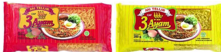
GAMBAR I-8 VARIAN PRODUK MIE TELUR CAP 3 AYAM PRODUKSI PT INDOFOOD CBP SUKSES MAKMUR TBK DIVISI NOODLE

Mie Telur Cap 3 Ayam adalah produk mie yang mudah diolah menjadi masakan utama dengan berbagai kreasi. Mie Telur Cap 3 Ayam terbagi menjadi 2 jenis yaitu Mie Telur keriting dan Mie Telur bulat. Produk Mie Telur Cap 3 Ayam dapat dilihat pada Gambar I-8.