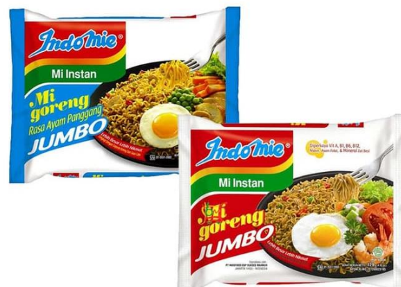
GAMBAR I-4 CONTOH PRODUK JUMBO NOODLE