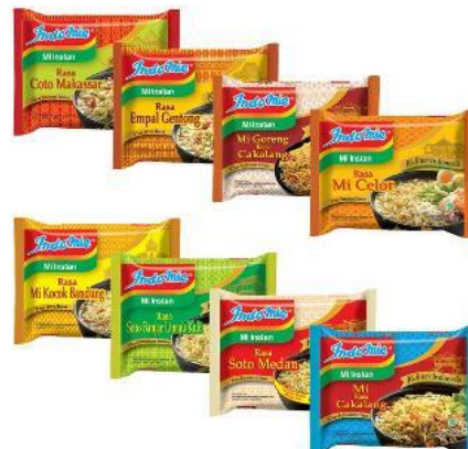
GAMBAR I-3 CONTOH PRODUK NORMAL NOODLE