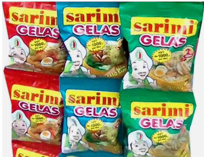
GAMBAR I-6 CONTOH PRODUK CUP NOODLE (Sumber: https://www.google.com/ )