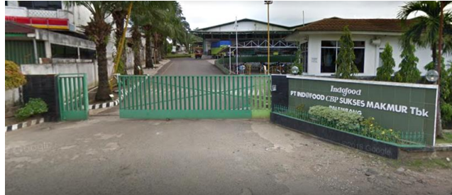
GAMBAR I-1 TAMPAK DEPAN PT INDOFOOD CBP SUKSES MAKMUR TBK.

Tampak depan PT Indofood CBP Sukses Makmur Tbk. dapat dilihat pada gambar I-1