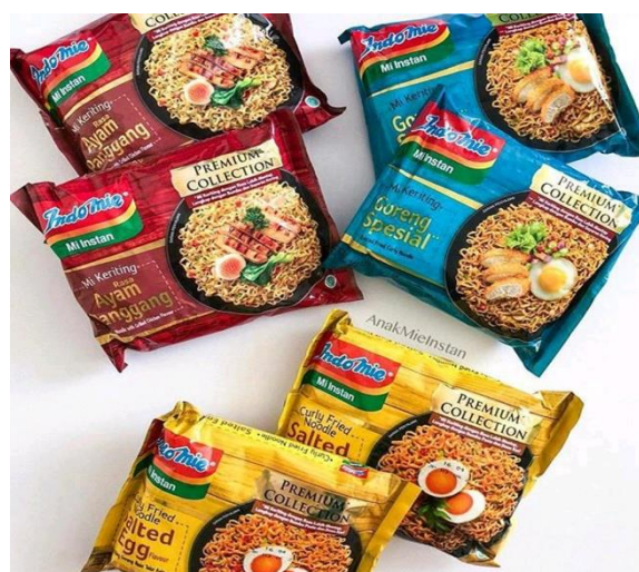
GAMBAR I-5 CONTOH PRODUK PREMIUM NOODLE