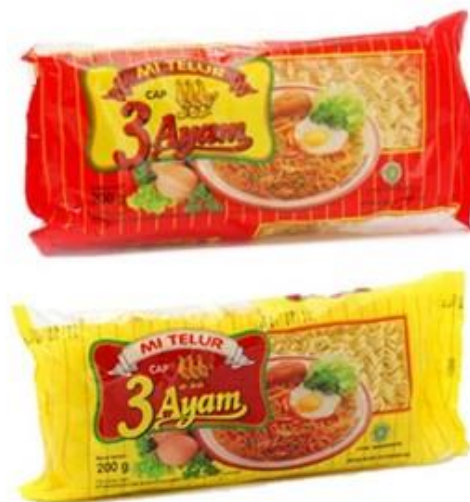
GAMBAR I-7 CONTOH PRODUK DRIED NOODLE (Sumber: https://www.google.com/ )