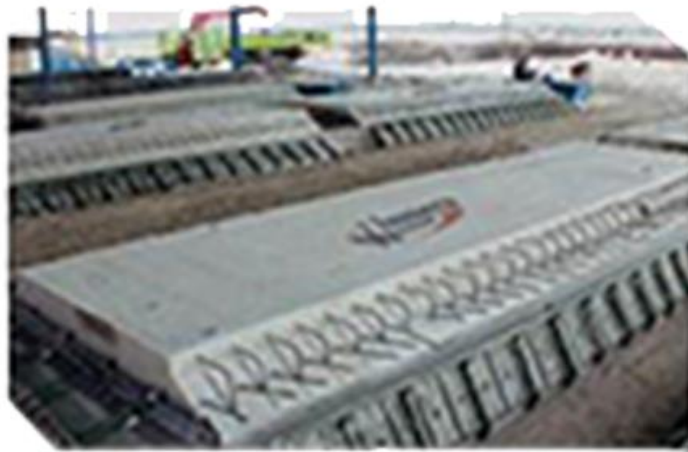
Gambar I.1 Beton Fullslab

Indonesia. Hal ini yang mendasari perusahaan untuk melakukan Penawaran Umum Perdana Saham ( Initial Public Offering ) di Bursa Efek Indonesia pada 20 September 2016 dengan melepas 10,54 Miliar lembar saham dengan harga penawaran Rp 490/Saham. Dengan demikian, perusahaan memperoleh dana segar dari IPO senilai Rp 5,16 Triliun dengan penjamin pelaksana emisi adalah PT Mandiri Sekuritas, PT Danareksa Sekuritas, PT Bahana Sekuritas, dan PT BNI Sekuritas.