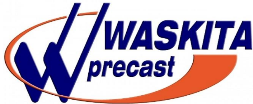
Gambar I.2 Logo Waskita