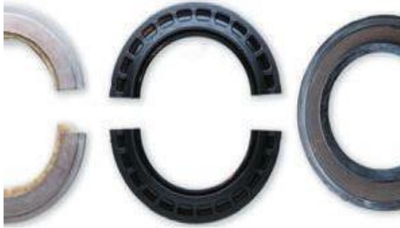
Lampiran 10 Plumer Block SNL