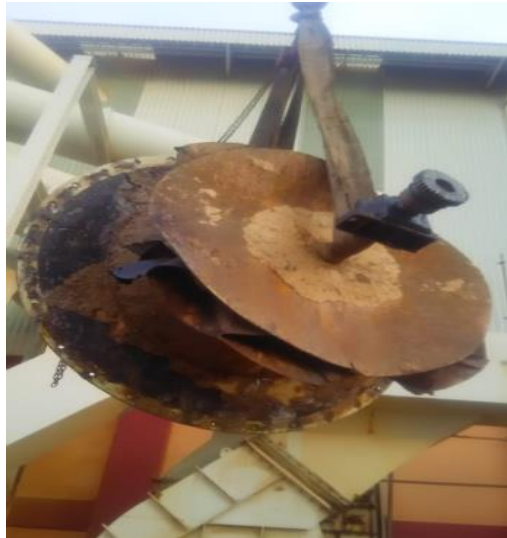
Lampiran 4 Cone