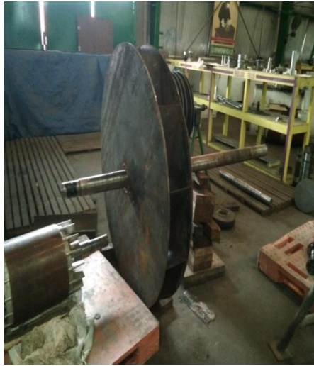
Lampiran 7 Bearing SKF 22220 E1K