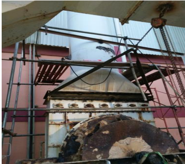
Lampiran 2 Pipa Elbow