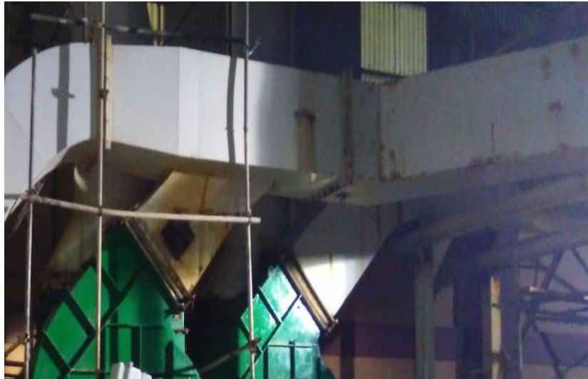
Lampiran 14 Casing Suction