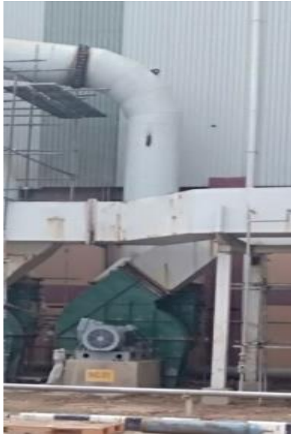
Lampiran 12 Motor Listrik