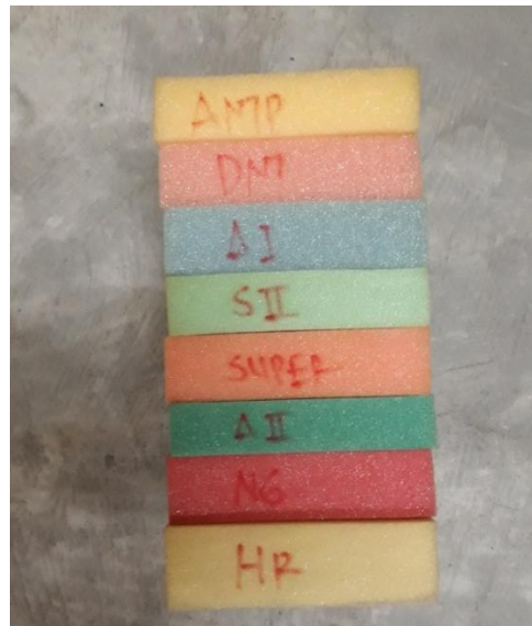
GAMBAR 1-3 JENIS BUSA YANG DIPRODUKSI