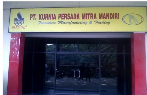
GAMBAR I-1 TAMPAK DEPAN PT KURNIA PERSADA MITRA MANDIRI