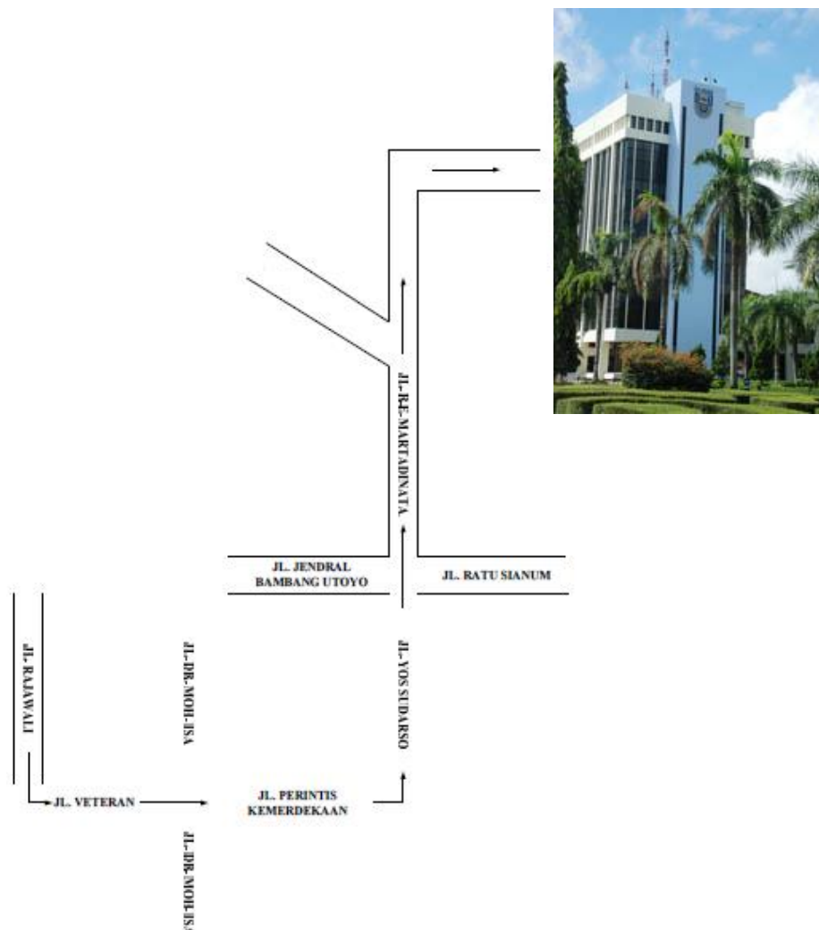
Gambar I.1 Lokasi PT Pusri Palembang

Lokasi PT Pupuk Sriwidjaja Palembang dapat dilihat pada gambar I.1