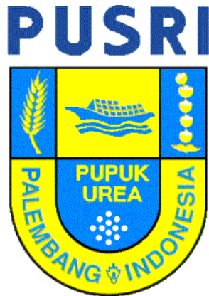
Gambar I.3 Logo PT Pusri