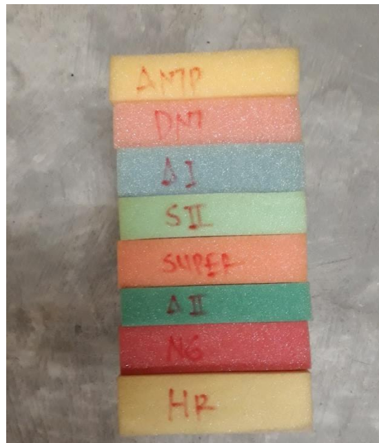
GAMBAR 1-3 JENIS BUSA YANG DI PRODUKSI

Untuk tipe busa yang dihasilkan terdapat delapan macam, yaitu ANTP, DNI, A1, S2, SUPER, A2, NAGA, dan HR. Untuk ukuran sofa yang diproduksi antara lain 11cm x 75cm x 190cm, 11cm x 80cm x 190cm, 11cm x 85cm x 190cm, 11cm x 90cm x 190cm, 11cm x 120cm x 190cm, 11cm x 150cm x 190cm, dan 11cm x 170cm x 190cm. Jenis busa yang diproduksi dapat dilihat pada gambar I-3.