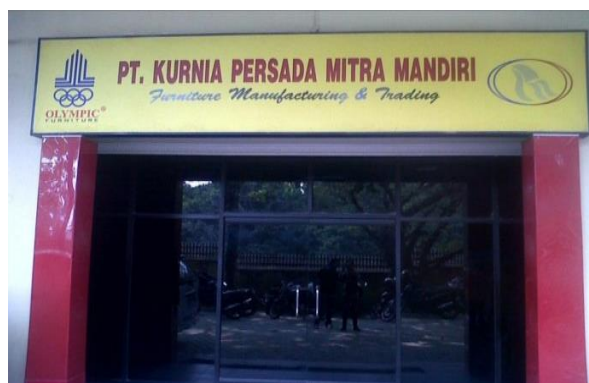
GAMBAR I-1 TAMPAK DEPAN PT KURNIA PERSADA MITRA MANDIRI

PT Kurnia Persada Mitra Mandiri Palembang memproduksi tiga jenis produk diantaranya springbed , sofa, dan kasur busa. Proses pembuatan furniture di PT Kurnia Persada Mitra Mandiri ini dimulai dari nol atau dari pembuatan bahan baku sampai produk jadi. Produk-produk tersebut didistribusikan ke toko-toko yang ada di kota Palembang, Pagar Alam, Muara Enim, Lahat, dan Prabumulih. Tampak depan PT Kurnia Persada Mitra Mandiri dapat dilihat pada gambar I-1.