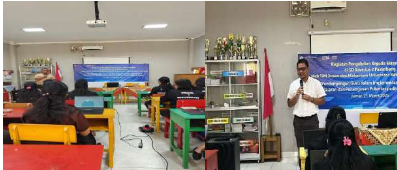
Gambar 1. Kata sambutan dari Kepala Sekolah dan Ketua PkM

PkM berdampak pada peningkatan pemahaman dan keterampilan mereka dalam digitalisasi pembelajaran dan pendampingan masa pubertas peserta didik.