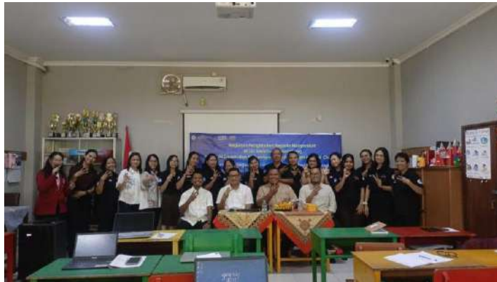
Gambar 4 Foto bersama

Berdasarkan data pre-test mengenai pengetahuan tentang digitalisasi pengajaran, hasil menunjukkan bahwa belum ada satupun guru yang sangat baik mengetahui tentang digitalisasi pengajaran. Mayoritas guru (64,3%) memiliki pemahaman mengenai digitalisasi pengajaran pada tingkatan baik, tetapi masih ada sejumlah guru (28,6%) yang berada pada tingkatan cukup sehingga membutuhkan lebih banyak pelatihan untuk memperdalam pengetahuan mereka. Ada pula sebagian kecil guru (7,1%) yang sama sekali belum mengetahui konsep digitalisasi pengajaran. Hal tersebut menunjukkan bahwa perlu adanya perhatian khusus dan pelatihan dasar dalam bidang ini. Setelah dilaksanakan kegiatan PkM terjadi perubahan, yakni hasil post-test menunjukkan bahwa sebagian besar guru (56,3%) sudah memiliki pemahaman yang sangat baik tentang digitalisasi pengajaran. Mereka sudah mampu menggunakan teknologi secara efektif dan memahami manfaatnya dalam pembelajaran. Sementara itu, 37,5% guru menunjukkan pengetahuan yang baik dan telah menggunakan beberapa alat digital dalam mengajar, meskipun masih membutuhkan peningkatan dalam keterampilan dan pemahaman mereka. Hanya sebagian kecil guru (6,2%) yang merasa pengetahuan mereka masih terbatas. Secara keseluruhan, hasil ini menunjukkan bahwa sebagian besar peserta memperoleh peningkatan dan semakin memperdalam pengetahuan dan keterampilan mereka dalam memanfaatkan teknologi untuk menciptakan pengalaman pembelajaran yang lebih efektif dan menarik.