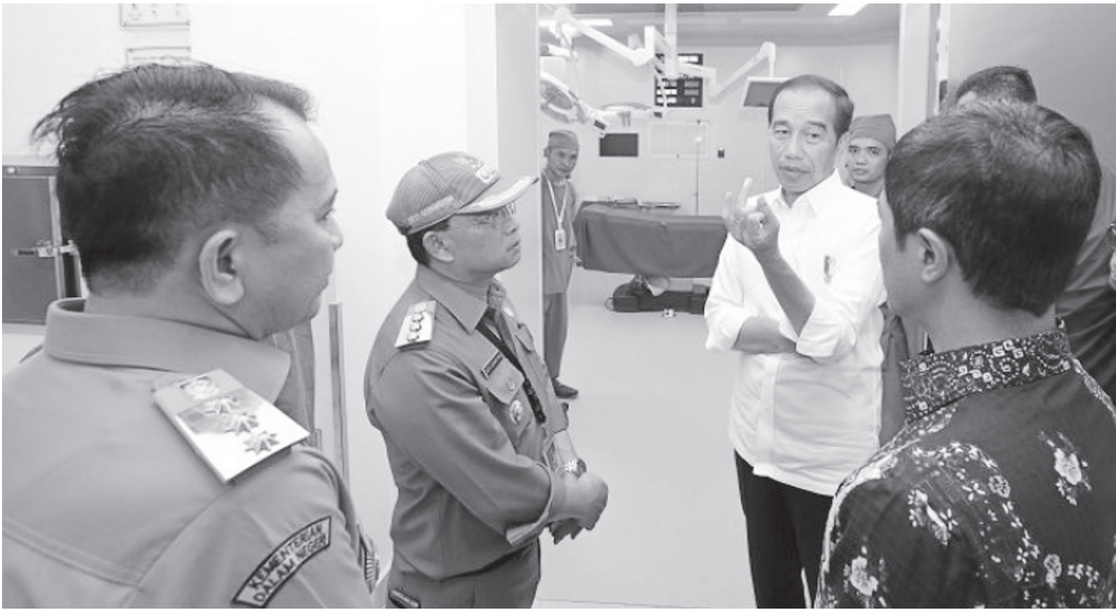
Presiden Jokowi meninjau RSUD Rupit di Kabupaten Musi Rawas Utara mengecek sumber daya manusia dan peralatan medis, peralatan operasi hingga CT scan.

Presiden juga menegaskan bahwa permasalahan listrik ini bukan hanya di rumah sakit, tapi juga mempengaruhi keseluruhan Kabupaten Musi Rawas Utara. Peningkatan infrastruktur listrik diharapkan segera terlaksana, mengingat pentingnya energi listrik dalam