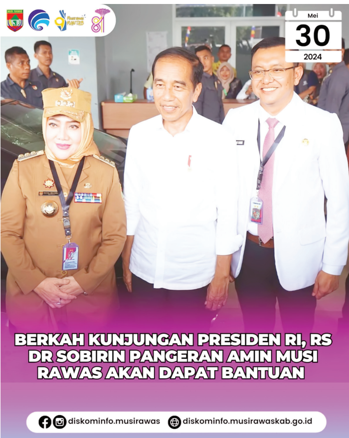
BERKAH KUNJUNGAN PRESIDEN RI, RS DR SOBIRIN PANGERAN AMIN MUSI RAWAS AKAN DAPAT BANTUAN

diskominfo.musirawas diskominfo.musirawaskab.go.id