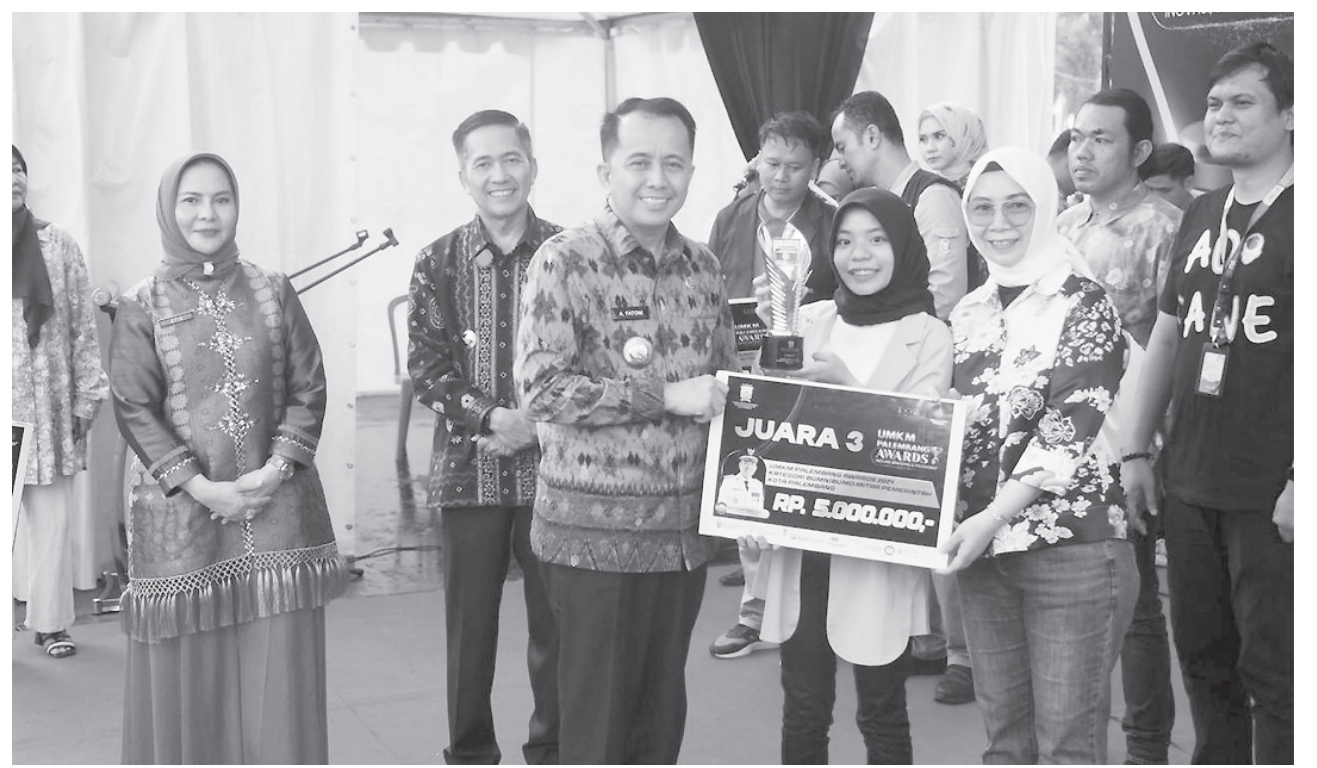
Penjabat Gubernur Sumatera Selatan Agus Fatoni memberi hadiah dalam kegiatan Puncak Penghargaan UMKM Palembang Awards 2024 di Plaza Benteng Kuto Besak (BKB) Palembang, Sumatera Selatan.

Dalam kesempatan yang sama, Pj Walikota Palembang Ratu Dewa mengawali menyebut geliat ekonomi di Kota Palembang semakin baik dengan