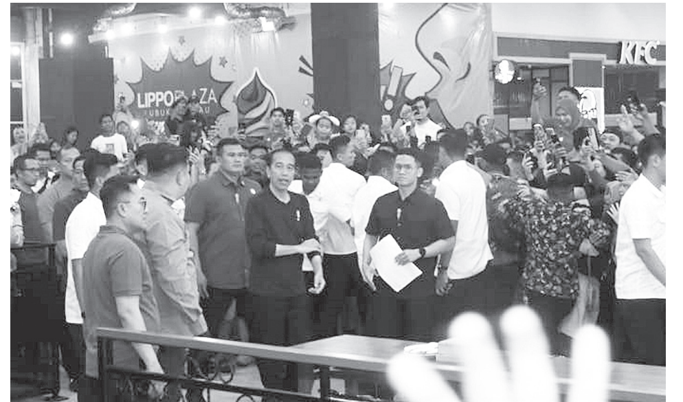
Presiden Republik Indonesia ke-7, Joko Widodo mengunjungi Lippo Plaza Lubuklinggau untuk sekedar makan malam.

"Dengan persiapan yang matang dan dukungan penuh dari masyarakat, kami yakin Desa Sumber Makmur dapat meraih hasil terbaik," pungkasnya. (net)