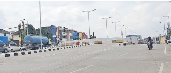
Flyover Sekip Ujung Palembang.