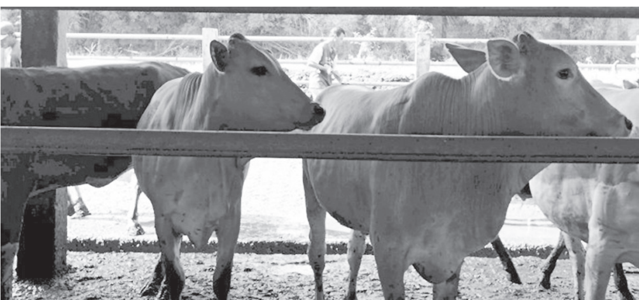
Disperptanikan Kabupaten Muratara akan melakukan pemantauan secara berkala terhadap kesehatan hewan ternak, khususnya yang didatangkan dari luar daerah.

"Sejauh ini belum ada penyakit hewan yang menonjol di Muratara, namun kami khawatir nanti ada penyakit yang masuk dari luar daerah," ujarnya. (*)