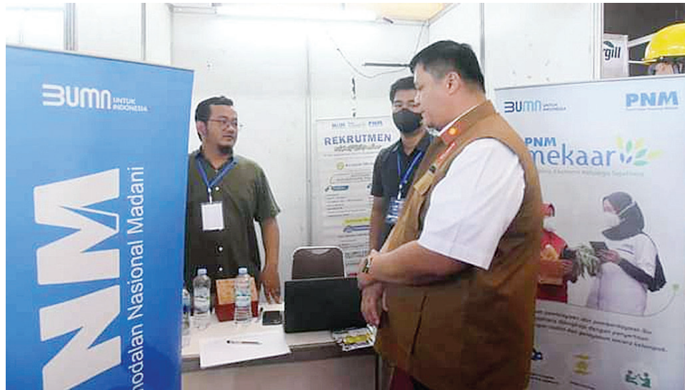
Dinas Ketenagakerjaan dan Transmigrasi menggelar acara Job Fair yang berlangsung 29-30 Mei 2024 di Gedung Graha Sedulang Setudung.

Kegiatan yang diinisiasi oleh Komisi Pemilihan Umum (KPU) Kabupaten Banyuasin tersebut dihadiri langsung oleh Pj Ketua TP PKK, Kapolres Banyuasin, Kajari Banyuasin diwakili Jaksa Intel, Dandim 0430, Kepala OPD dan Kabag, Ketua KPU Provinsi Sumsel diwakili, Ketua Bawaslu Banyuasin. (*)