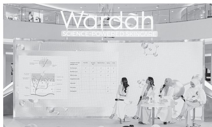
Wardah turut memperkenalkan science powered skin innovation sebagai solusi efektif untuk mencapai berbagai skin goals.

It's so easy to get a glass skin with Wardah! Melalui beberapa rangkaian produk berikut, kulit tampak lebih cerah dan sehat. Berikut rekomendasi produk yang bisa Anda coba yaitu Wardah Crystal Secret Exfoliating Toner: 2.5% Natural AHA + PHA bekerja haluskan tekstur dan angkat sel kulit mati, Wardah Crystal Secret Dark Spot & Brightening Serum: Serum yang dilengkapi dengan 3% Tranexamic + Alpha Arbutin samarkan hiperpigmentasi, noda hitam, dan bekas jerawat, Wardah Lightening Serum Ampoule: 5% Niacinamide ADV + Bisabolol ratakan kusam, belang, dan warna tidak merata dan Wardah Radiant Charge Gel Moisturizer: Pelembab dengan Vitamin C + Adenosine sebagai antioksidan kuat untuk kulit cerah glowing