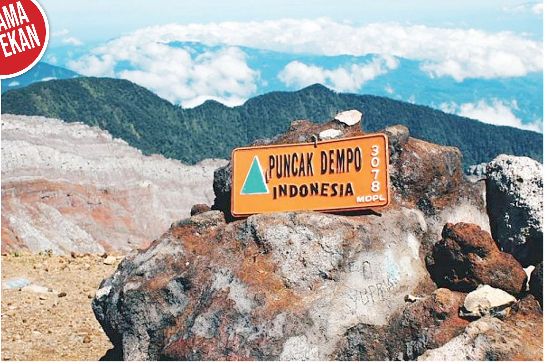
Puncak Gunung Dempo di Kota Pagar Alam.