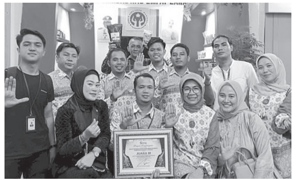
Pemkab Empat Lawang raih juara 3 stand terbaik.

"Saat ditangkap di rumahnya terduga melakukan perlawanan dan terpaksa petugas berikan tindakan tegas, terukur dan langsung digiring ke Mapolres Pagalaralam untuk diproses hukum lebih lanjut," pungkasnya. (rep)