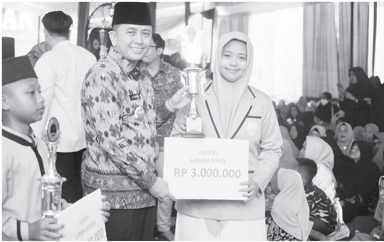
Penjabat Gubernur Sumatera Selatan (Sumsel) Agus Fatoni menghadiri Festival Santri Cinta Al-Quran.

pedulian Pemerintah Kota Palembang Palembang kepada masyarakat," ujarnya. (*)