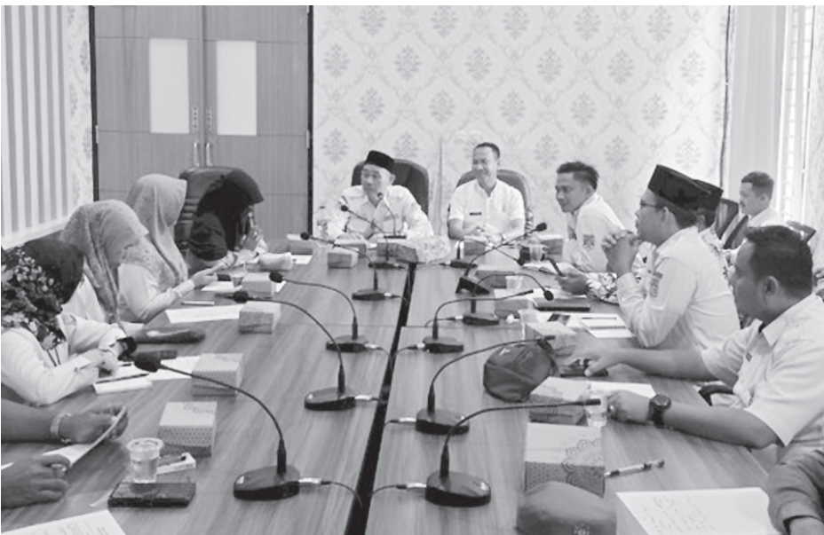
DPMDP3A Muratara tengah mempersiapkan Desa Sumber Makmur untuk mengikuti lomba Desa tingkat Provinsi Sumatera Selatan.

MURATARA, MEDIASRIWIJAYA-Pemerintah Kabupaten Muratara melalui Dinas Pemberdayaan Masyarakat Desa, Perlindungan Perempuan, dan Perlindungan Anak (DPMDP3A) Muratara tengah mempersiapkan Desa Sumber Makmur untuk mengikuti lomba Desa tingkat Provinsi Sumatera Selatan (Sumsel).