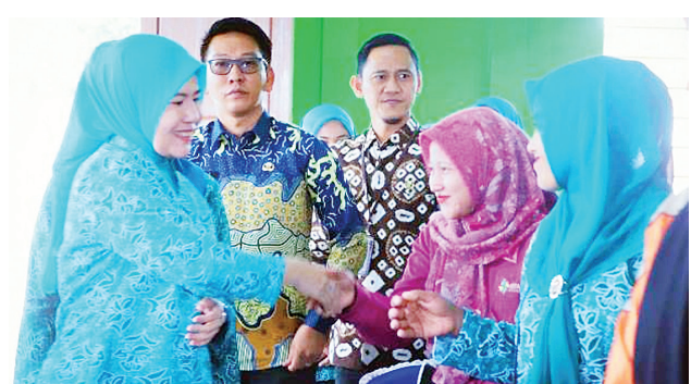
Tim PKK Kabupaten Muba melakukan pembinaan desa/kelurahan PHBS, Posyandu dan Kader berprestasi.

MUBA, MEDIASRIWIJAYA – Guna meningkatkan kualitas kesehatan hidup dan kesejahteraan masyarakat, Tim PKK Kabupaten Musi Banyuasin (Muba) melakukan pembinaan desa/kelurahan Perilaku Hidup Bersih dan Sehat (PHBS), Posyandu dan Kader berprestasi, kegiatan berlangsung di Desa Beji Mulyo Kecamatan Tunggal Jaya, Jumat (31/5).