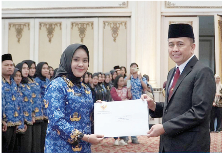
Pj Gubernur Sumsel Agus Fatoni meresmikan dan mengukuhkan 1.345 PPPK di lingkungan Provinsi Sumatera Selatan Formasi Tahun 2023 di Gedung The Sultan Convention Center Palembang, Jumat (31/5).