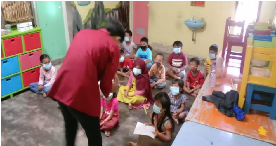
Gambar 2. Pelaksanaan kegiatan penyuluhan